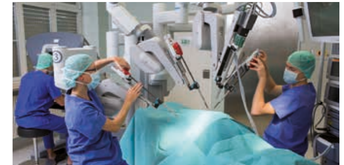
Modellbild des roboterassistierten OP-Systems da Vinci® Si