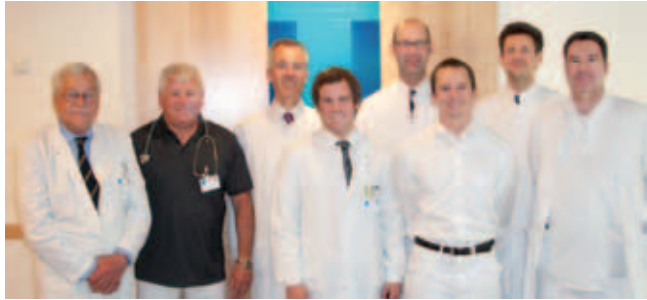
Das Team des Gefäßzentrums